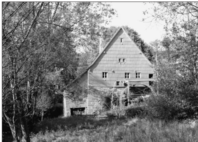
DRK Kreisverband Buchen