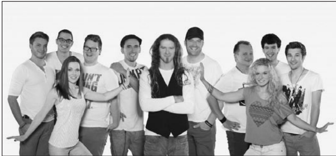
Mudauer Jugend e.V.

Achtung: Karten gibt es nur an der Abendkasse – Kein Eintritt für Jugendliche unter 18 Jahren.